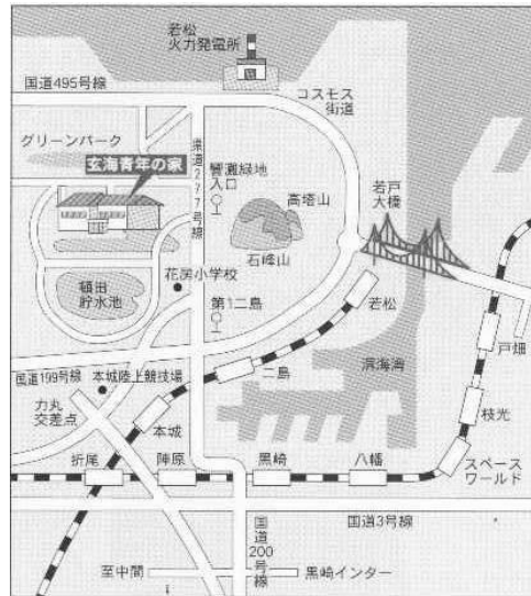
北九州市営バス二島經由脇田または岩屋行 響灘緑地入口下車徒歩10分